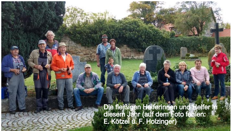
Die fleißigen Helferinnen und Helfer in diesem Jahr (auf dem Foto fehlen: E. Kötzel u. F. Holzinger)