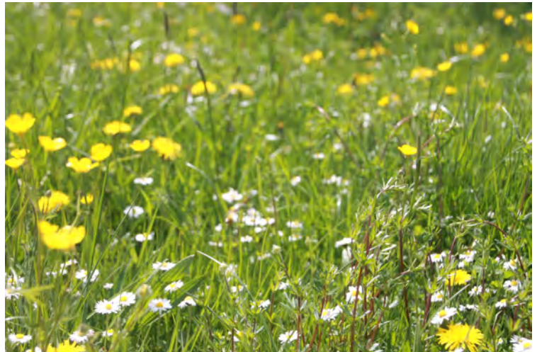
Bildunterschrift_Wiese_IMG_5040: Das Vertragsnaturschutzprogramm erhält und verbessert ökologisch wertvolle Lebensräume durch naturschonende Bewirtschaftung.

Anmeldung: www.landkreis-ansbach.de oder Tel. 0981 468-1030