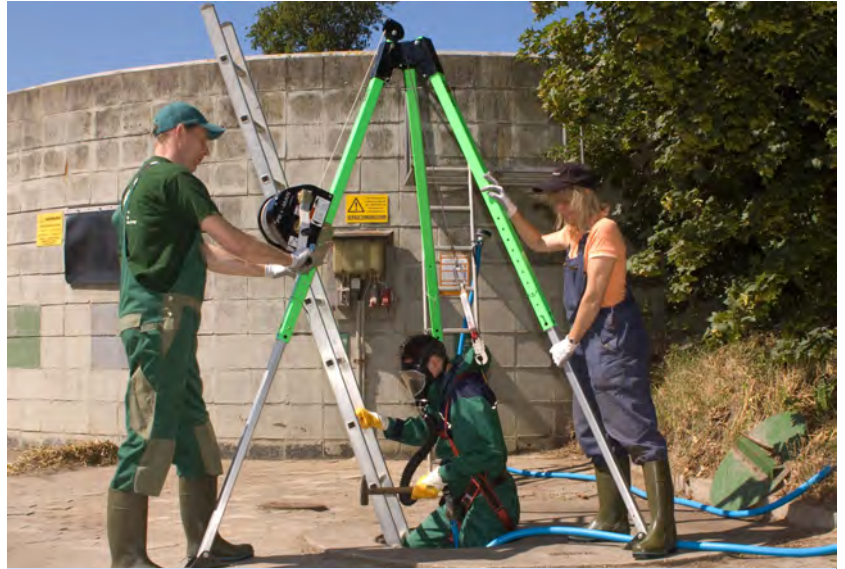
Einstieg ins Güllelager am Rettungsgurt mit einem umluftunabhängigen Frischluftgerät – gesichert durch zwei Personen.

Jährlich ereignen sich etwa 33.000 meldepflichtige Arbeitsunfälle* in der Landwirtschaft. Davon ereignen sich durchschnittlich 163 beim Umgang mit Gülle. Zwei dieser Unfälle enden im Schnitt tödlich. Die meisten Unfälle ereignen sich bei der Arbeit an Güllefass, Güllerührwerk, Güllerpumpe sowie Schläuchen und Leitungen. Etwa acht Prozent der Unfälle stehen im Zusammenhang mit Güllegäsen. In Güllegruben entstehen Schwefelwasserstoff, Kohlenstoffdioxid, Methan und Ammoniak. In höherer Konzentration ist Schwefelwasserstoff nicht mehr wahrnehmbar, weil der Geruchsnerv gelähmt wird. Beim Einatmen drohen Bewusstlosigkeit und Atemstillstand. Schon wenige Atemzüge reichen aus. Kohlendioxid birgt Vergiftungs- und Erstickengefahr. Methan bildet mit Sauerstoff ein explosives Gemisch. Daher sind in Gülleanlagen offenes Feuer, Funkenbildung und Rauchen verboten.