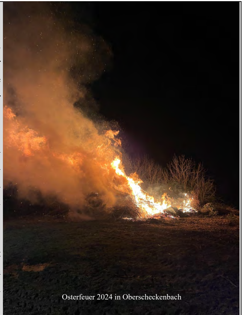
Osterfeuer 2024 in Oberscheckenbach