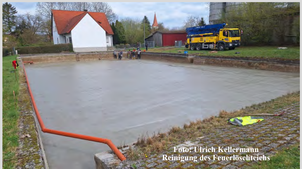
Reinigung des Feuerlöschteichs

Ein herzlicher Dank gilt der Freiwilligen Feuerwehr, der Bauernkapelle sowie der ELJ für die gelungenen Veranstaltungen im April. Alles war bestens organisiert und verlief reibungslos.