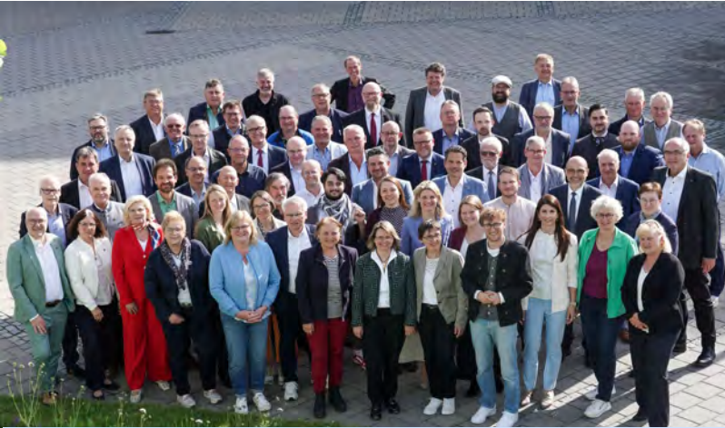
Bildunterschrift: Die Kreistagsmitglieder der Wahlperiode 2026 bis 2032 mit Landrat Marco Meier (vorderste Reihe, rechts).